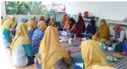
Gambar 1. Pendidikan Kesehatan tentang hipertensi dan kolesterol

Peningkatan pemahaman dan keterampilan ini secara psikologis membuat ibu lebih mengerti dan meningkatkan kesadaran tentang pentingnya menjaga pola makan dan gaya hidup.