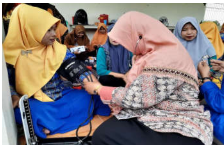
Gambar 2. Pengukuran Tensi dan Kolesterol

Peningkatan pemahaman dan keterampilan ini secara psikologis membuat ibu lebih mengerti dan meningkatkan kesadaran tentang pentingnya menjaga pola makan dan gaya hidup.