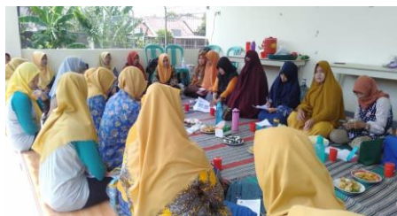
Gambar 1. Pendidikan Kesehatan tentang hipertensi dan kolesterol

Peningkatan pemahaman dan keterampilan ini secara psikologis membuat ibu lebih mengerti dan meningkatkan kesadaran tentang pentingnya menjaga pola makan dan gaya hidup.