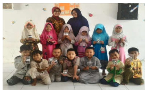
Gambar 2. Pemberian COMUT

Pertama para responden melakukan persetujuan terlebih dahulu terhadap perlakuan atau tindakan pemberian produk ini, kemudian dilanjutkan pemberian informasi tentang kegunaan/manfaat, dosis pemberian dan penjelasan questioner yang diisi. Untuk anak usia dini dan anak-anak, kami memberikan penjelasan dan meminta persetujuan kepada orang tua murid. Pengamatan dilakukan selama 5 hari dengan melakukan pencatatan pada questioner nafsu makan dan tabel observasi frekuensi dan porsi makan setiap hari.