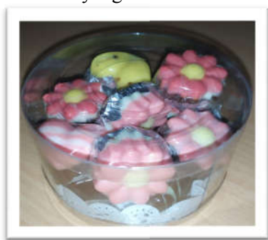
Gambar 1. Coklat Temulawak Imut (COMUT)

Pengemasan dilakukan dengan menggunakan kertas alumunium foil dan plastik warp. Pemilihan bahan kemasan ini dipilih karena kertas alumunium foil berfungsi untuk menahan coklat meleleh. Kemudian plastik warp digunakan untuk memudahkan orang melihat karakter bentuk coklat yang sudah dibuat.