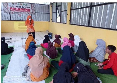
Gambar 1. Edukasi tentang pubertas pada remaja

Selain pemberian pendidikan kesehatan, remaja dilakukan pemeriksaan kesehatan meliputi penimbangan berat badan, pengukuran tinggi badan dan lingkaran perut. Bagi remaja putri yang telah menstruasi ditambah dengan pemeriksaan kadar hemoglobin dan gula darah serta pemberian tablet tambah darah.