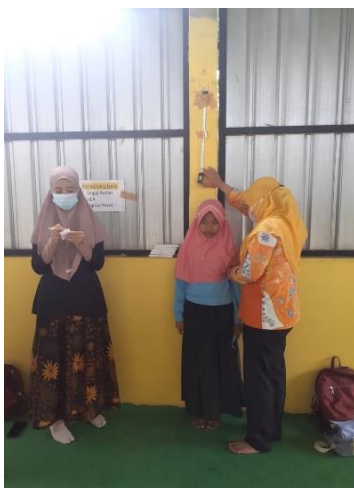
Gambar 2. Pemeriksaan tinggi badan pada remaja