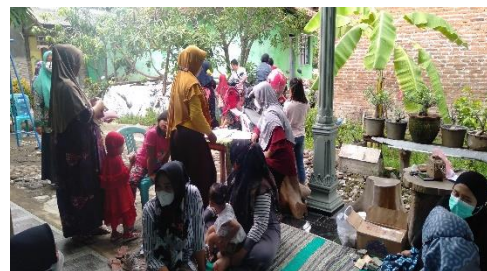
Gambar 1. Pelaksanaan pengabdian masyarakat oleh penulis

Refreshing kader adalah kegiatan dalam mengembangkan keterampilan kader melalui pengetahuan yang dimiliki melalui pembelajaran dari dalam diri maupun luar diri individu. Kader harus terampil dalam mencatat, membaca dan melakukan pengukuran antropometri, penilaian status gizi serta menyampikan penyuluhan atau penyebaran informasi kesehatan terkait gizi bayi dan balita. Kader harus juga mampu menggerakkan serta mengajak ibu-ibu sekitar yang mempunyai bayi dan balita untuk hadir dan berpartisipasi dalam kegiatan Posyandu. Sehingga kader-kader Posyandu diharapkan mampu memaksimalkan peran serta melakukan transfer pengetahuan kepada masyarakat terkait dengan program-program pemerintah. (7)