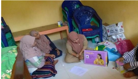
Gambar 1. Penyuluhan booklet

membantu penyampaian informasi lebih mudah.