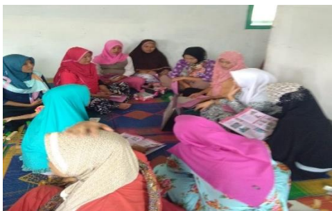
Gambar 2. Penyuluhan booklet