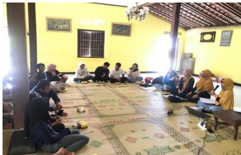
Gambar 1. Diskusi dan penyampaian Materi

Pada saat pelaksanaan kegiatan para peserta tampak sangat antusias dalam memberikan pendapatnya.