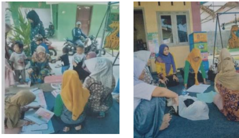
Gambar 1 Implementasi pengabdian kepada masyarakat

Kegiatan pengabdian ini diawali dengan mengajukan 25 pertanyaan pre- test . Materi pre dan post test yang diberikan sama yaitu tentang kebutuhan gizi dan pencegahan stunting. Hasil sebelum dan sesudah kegiatan berupa penyuluhan ditunjukkan pada diagram berikut: