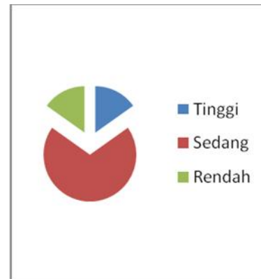
Gambar 2. Prestasi belajar mahasiswa

Berdasarkan gambar 2 diatas menunjukkan bahwa sebagian besar mahasiswa memiliki prestasi belajar yang terkategori sedang yaitu 69 orang (69,7%).