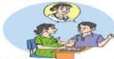
2. Menentukan pendong dan tempat persalinan