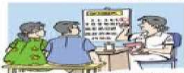
1. Mengetahui perkiraan tanggal persalinan