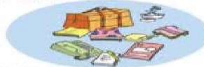
6. Menyiapkan kebutuhan persalinan