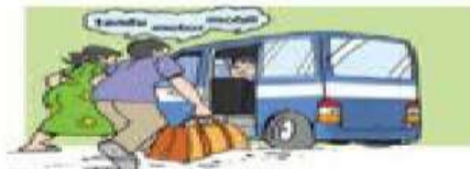
4. Menyiapkan kendaraan