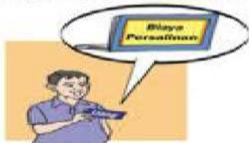
3. Tabulin (Biaya Persalinan)